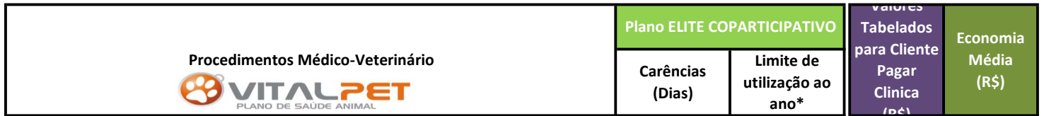
TABELA COM COBERTURAS, CARÊNCIAS E LIMITES DE USO (PLANO ELITE COPARTICIPATIVO)