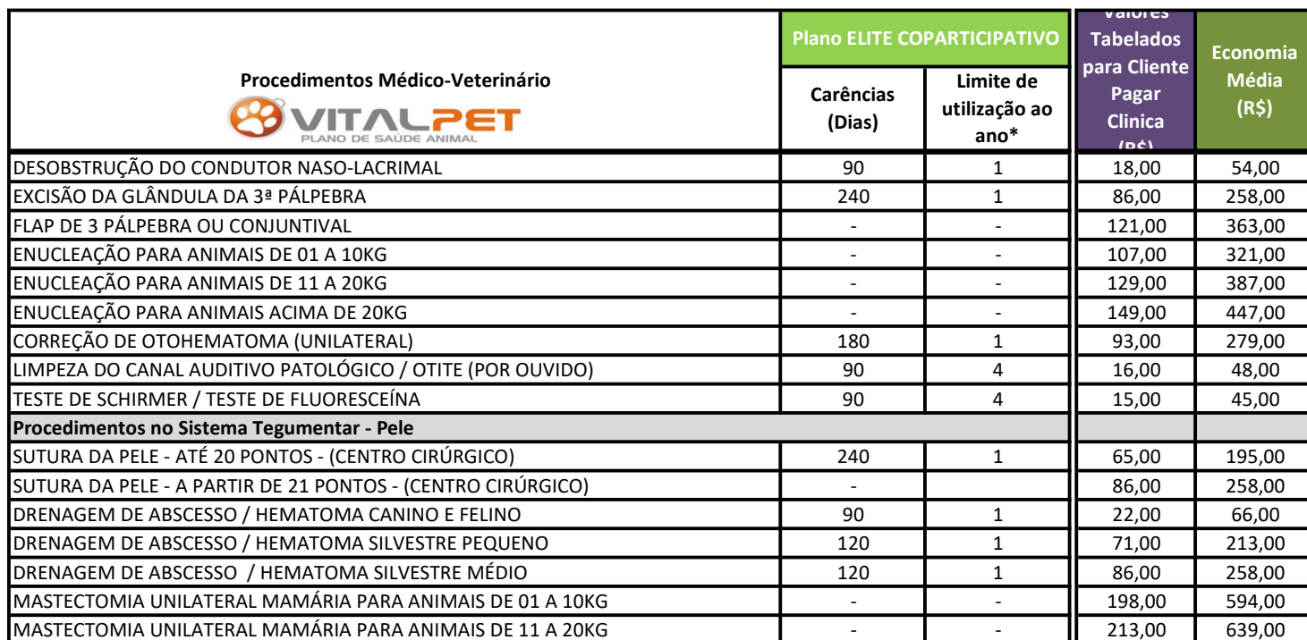
TABELA COM COBERTURAS, CARÊNCIAS E LIMITES DE USO (PLANO ELITE COPARTICIPATIVO)